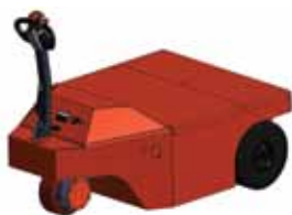
XXXL 40 000

Ручные/поводковые электрические тягачи. Буксируемая масса до 45000 кг для колесных грузов и 60000 кг для грузов на рельсах, скорость 1-6 км/ч