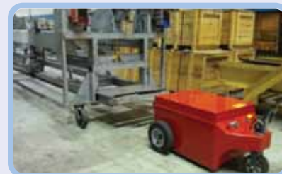
логистика и склад