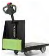
P300 600 x 1000