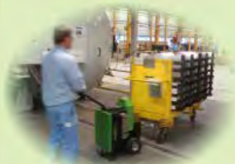
Промышленность и производство