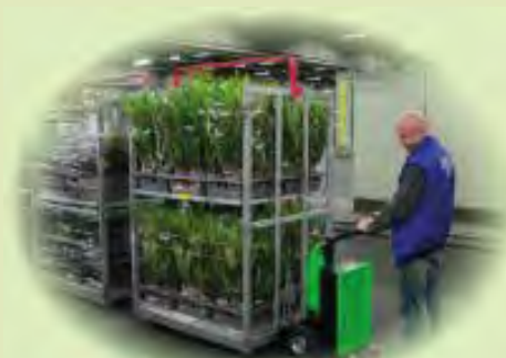
Сельское и подсобное хозяйство