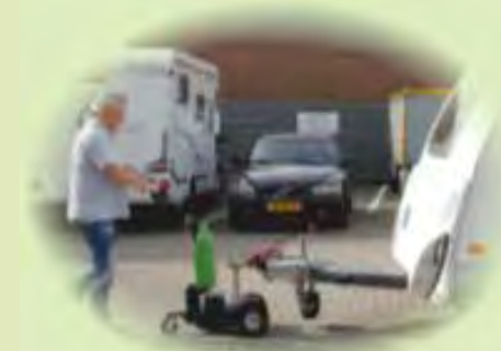
Перемещение прицепов и трейлеров