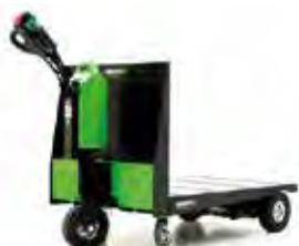
P300 800 x 1200

Электрические тележки Грузоподъемность 750 кг, скорость 1-9,6 км/ч