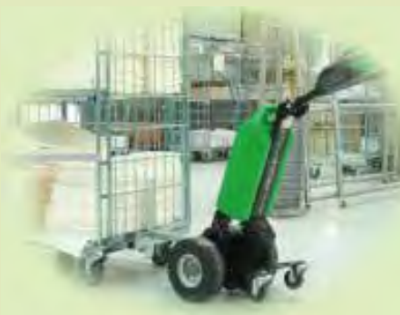
Клининговые компании и уборка