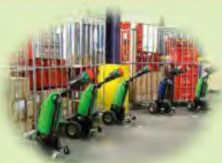
Логистика и склад