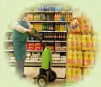
Супермаркеты и ритейл